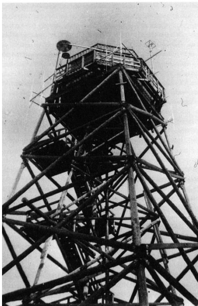
Tärnbo torn på 1950-talet